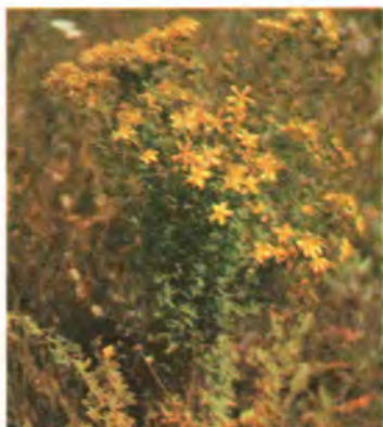
574. Звіробій звичайний.